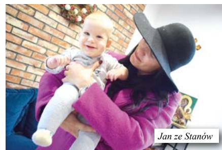
Jan ze Stanów