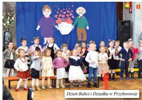
Dzień Babci i Dziadka w Przyborowie