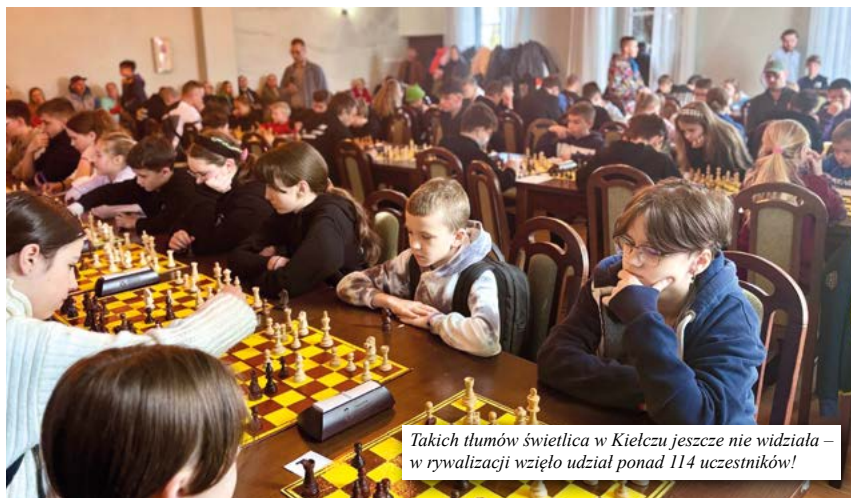
Takich tłumów świetlica w Kielczu jeszcze nie widziała – w rywalizacji wzięło udział ponad 114 uczestników!

nicy z całej Polski, w tym z województw: wielkopolskiego, dolnośląskiego i lubuskiego. Co ciekawe, wśród zawodników znalazł się również gość z zagranicy – reprezentant Słowacji, który dodał imprezie międzynarodowego charakteru. Turniej okazał się nie tylko liczny, ale i bardzo owocny pod względem sportowym. Aż 28 uczestników uzyskało normy na wyższe kategorie szachowe, co potwierdza wysoki poziom rywalizacji oraz świetną organizację zawodów. Kolejne szachowe