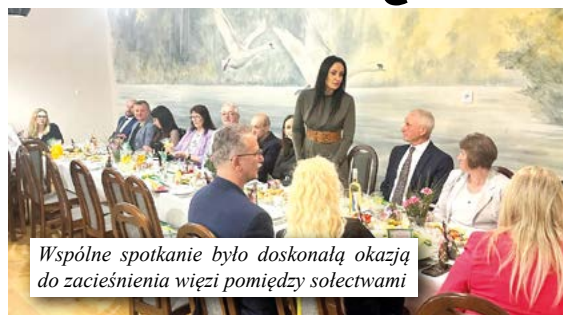
Wspólne spotkanie było doskonałą okazją do zacieśnienia więzi pomiędzy sołectwami

raz wdzięczności za ich trud i poświęcenie. Wójt gminy podkreśliła rolę sołtysów jako nieocenionych przedstawicieli mieszkańców i życzyła im dalszej wytrwałości, satysfakcji z pełnionej funkcji oraz sukcesów w realizacji zaplanowanych inicjatyw. Dziękujemy wszystkim za obecność oraz za codzienną pracę na rzecz rozwoju naszych sołectw. Raz jeszcze składamy serdeczne życzenia z okazji Dnia Sołtysa!