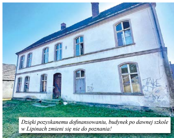
Dzięki pozyskanemu dofinansowaniu, budynek po dawnej szkole w Lipinach zmieni się nie do poznania!

modernizację dwóch budynków – dawnej szkoły w Lipinach oraz Referatu Gospodarczego w Kielczu. Całkowita wartość ww. zadań wyniesie blisko 3,6 mln zł. Dofinansowanie pokryje 85% kwoty całkowitych wydatków kwalifikowalnych Projektu. Więcej na temat tych inwestycji będzie można przeczytać w kolejnych wydaniach „Naszycy Wieści”.