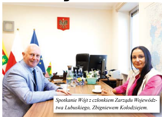
Spotkanie Wójt z członkiem Zarządu Województwa Lubuskiego, Zbigniewem Kołodziejem.

retencji wodnej, organizowany w ramach Krajowego Planu Odbudowy. Program ten ma na celu nie tylko poprawę gospodarowania zasobami wodnymi, ale również zwiększenie odporności lokalnych społeczności na skutki zmian klimatu. W trakcie spotkania poruszono również temat dróg dojazdowych do pól i projektów ekologicznych. Składamy serdeczne podziękowania za dofinansowanie projektu dot. nasadzeń drzew miododajnych w naszej gminie– istot-