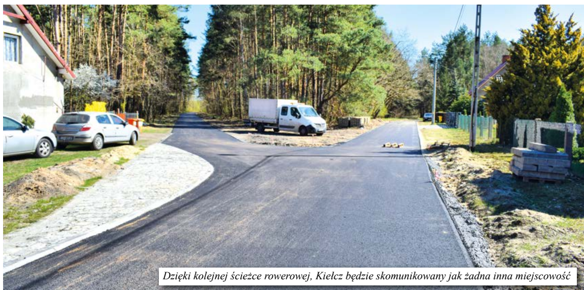
Dzięki kolejnej ścieżce rowerowej, Kielcz będzie skomunikowany jak żadna inna miejscowość

zaczną powstawać kolejne ścieżki, np. zostały już zlecone prace projektowe na budowę odcinka przy drodze 297 relacji Wrociszów-Lubieszów, w kierunku Osiedla Grafitowego.