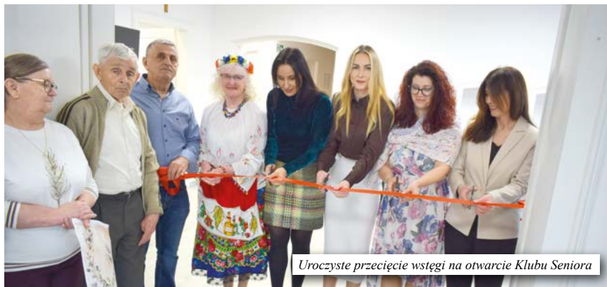
Uroczyste przecięcie wstęgi na otwarcie Klubu Seniora