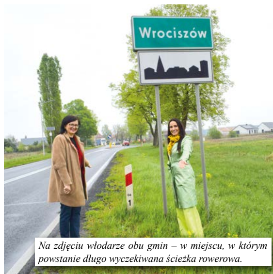
Na zdjęciu władze obu gmin – w miejscu, w którym powstanie długo wyczekiwana ścieżka rowerowa.

runkach – zarówno do Koźuchowa, jak i do Lubieszowa. - Nie tak dawno skomunikowaliśmy Kielcz z Nową Solą, a na etapie końcowym jest budowa ścieżki z Kielcza do Bytomia Odrzańskiego. Teraz skomunikowany w obie strony będzie Wrociszów. Dzięki tym działaniom nasza gmina nie tylko wpisuje się w ogólnopolskie trendy proekologicznego transportu, ale także realnie zwiększa bezpieczeństwo i komfort codziennego życia mieszkańców. Dzisiejsze podpisanie umowy to świetna wiadomość dla rowerzystów, rodzin z dziećmi, a także tury-