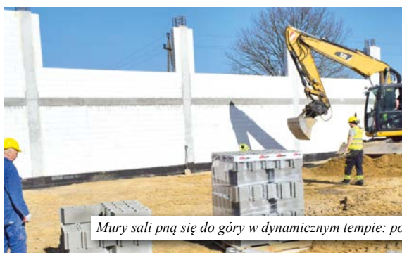
Mury sali pną się do góry w dynamicznym tempie: po lewej stronie zdjęcie z budowy w marcu, a po prawej w kwietniu.