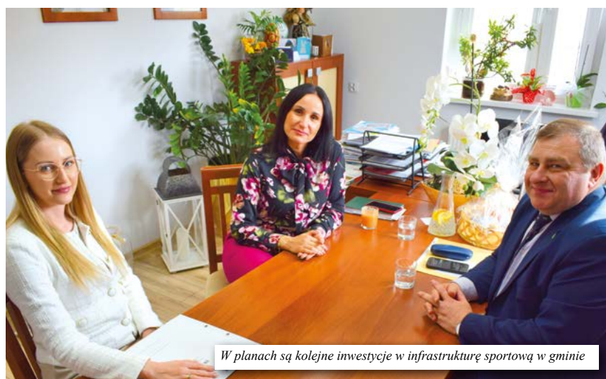
W planach są kolejne inwestycje w infrastrukturę sportową w gminie

– w tym dofinansowania z Urzędu Marszałkowskiego. Serdecznie dziękujemy Panu Wicemarszałkowi za wizytę oraz zainteresowanie sprawami Gminy Nowa Sól. - Co prawda, udało nam się zrobić już naprawdę wiele, jeśli chodzi o infrastrukturę sportową. Do tej pory korzystaliśmy z wszystkich możliwych naborów związanych z dofinansowaniem naszych boisk. Powstały nawodnienia, nowe trybuny itp., ale z nadzieją i optymizmem patrzymy na przyszłość kolejnych