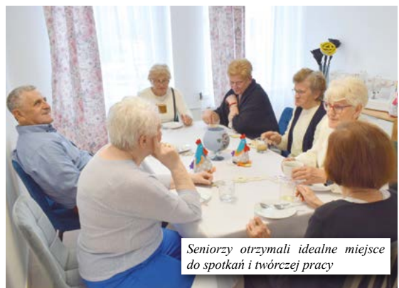
Seniorzy otrzymali idealne miejsce do spotkań i twórczej pracy