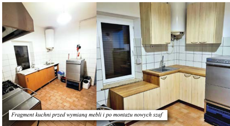
Fragment kuchni przed wymianą mebli i po montażu nowych szaf

Nawiązując do poprzedniego artykułu, śmiało możemy stwierdzić, że modernizacje świetlic, remonty, nowe aranżacje wnętrz oraz doposażenie w meble i urządzenia to codzienna rzeczywistość naszej Gminy. Wszystko to nie byłoby możliwe bez aktywnej współpracy z sołtysami i radami sołectw, którzy dbają o ich stan i sygnalizują potrzeby modernizacyjne. Sołtys, jako osoba sprawująca pieczę nad świetlicami, odgrywa kluczową rolę w dbałości o stan tych obiektów. Jednym z najnowszych efektów tej owocnej współpracy jest montaż nowych mebli kuchennych w świetlicy wiejskiej w Lubieszowie. Realizacja tego przedsięwzięcia była odpowiedzią na zgłoszoną potrzebę wymiany wysłużonego wyposażenia, co ma wpłynąć na poprawę funkcjonalności i estetyki kuchni. Koszt inwestycji to blisko 14 tys. zł.