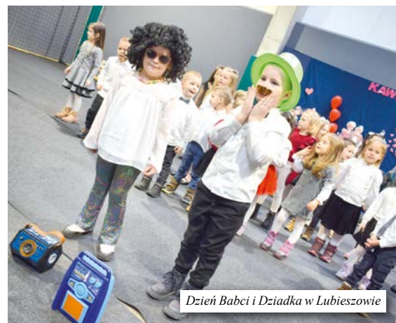
Dzień Babci i Dziadka w Lubieszowie