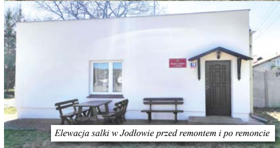
Elewacja salki w Jodłowie przed remontem i po remoncie