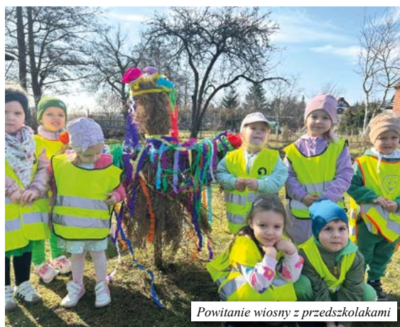
Powitanie wiosny z przedszkolakami

Jesteście ciekawi, co będzie działo się w najbliższych trzech miesiącach? Koniecznie prze-