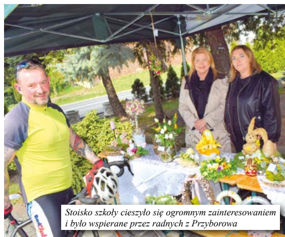
Stoisko szkoły cieszyło się ogromnym zainteresowaniem i było wspierane przez radnych z Przyborowa

dziców oraz radnym z Przyborowa. To dzięki Wam ten dzień był tak wyjątkowy!