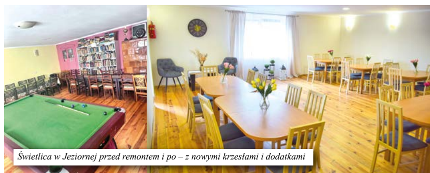
Świetlica w Jeziornej przed remontem i po – z nowymi krzesłami i dodatkami

wiejskiej w Kielczu. Inwestycje te zostały zrealizowane dzięki środkom z budżetu gminy oraz wsparciu sołectw. Władze gminy konsekwentnie realizują politykę modernizacji i poprawy warunków obiektów publicznych, odpowiadając tym samym na potrzeby