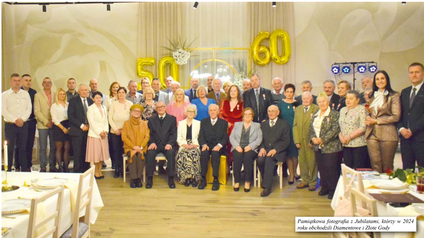
Pamiątkowa fotografia z Jubilatami, którzy w 2024 roku obchodzili Diamentowe i Złote Gody