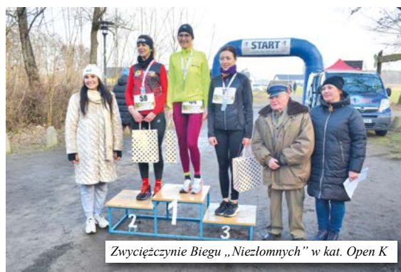
Zwycięzynie Biegu „Niezlomnych” w kat. Open K

decznie gratulujemy! Dla biegaczy oraz kibiców został przygotowany poczęstunek: grochówka, kielbaski z grilla, ciasto,