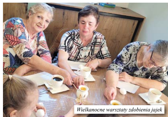
Wielkanocne warsztaty zdobienia jajek

Centrum w Lubięcinie. Warto, bo tam zawsze dzieje się coś interesującego. Minione wydarzenia, z których mogli skorzystać nasi mieszkańcy