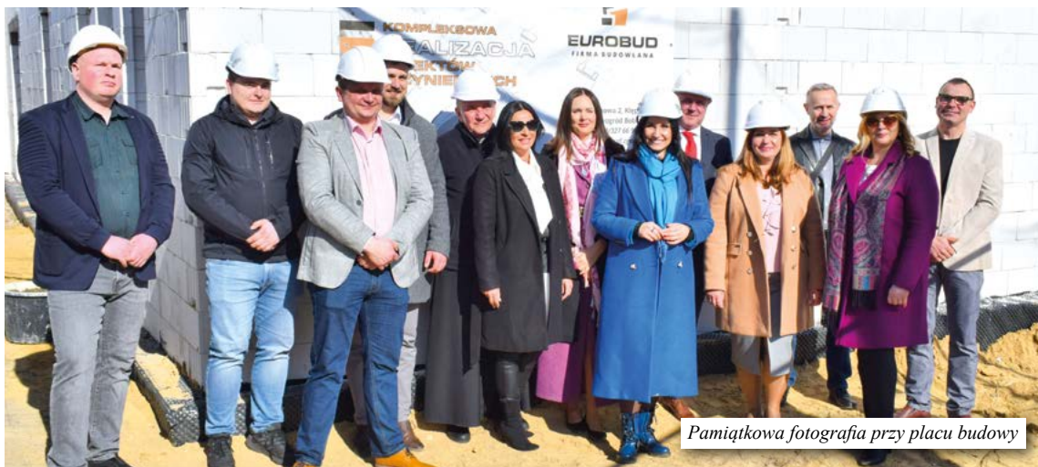
Pamiątkowa fotografia przy placu budowy

6 marca 2025 r. zapisa- liśmy nową kartę w histo- rii naszej gminy. Z wielką radością i dumą uczestni- czyliśmy w uroczystym wmurowaniu kamienia węgielnego pod „Budowę boiska wielofunkcyjnego wraz z zadaniem o stałej konstrukcji przy Ze- spole Edukacyjnym w w Przyborowie, tzw. Przybo- rów Areny. To ważny krok ku lepszym warunkom do uprawiania sportu i rozwi- niania pasji wśród dzieci, młodzieży szkolnej. W wydarzeniu wzięli udział