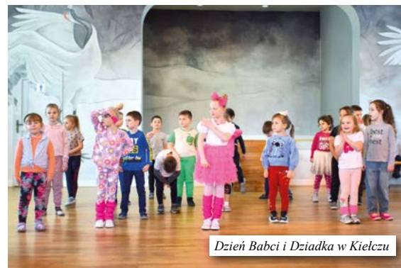
Dzień Babci i Dziadka w Kielcu

jątkowe. Były to piękne uroczystości pełne wzruszeń, radości i talentu najmłodszych. Dzieci przygotowały wierszyki, piosenki, tańce i scenki, które chwyciły za serca publiczności i zostały nagrodzone gromkimi brawami! Serdecznie dziękujemy Paniom Wychowawczyniom za szlifowanie naszych małych diamentów, dzieciom gratulujemy wspaniałych występów, a dziadkom – cudownych i utalentowanych wnuków!