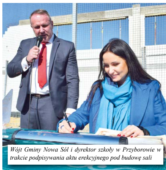
Wójt Gminy Nowa Sól i dyrektor szkoły w Przyborowie w trakcie podpisywania aktu erecyjnego pod budowę sali

gimnastyczna w Przybo- rowie stanie się miejscem, gdzie sportowe marzenia nabiorą realnych kształtów Jeszcze raz dziękujemy wszystkim, którzy przy- czynili się do realizacji tego projektu i już dziś zapraszamy na wielkie otwarcie nowego obiektu.