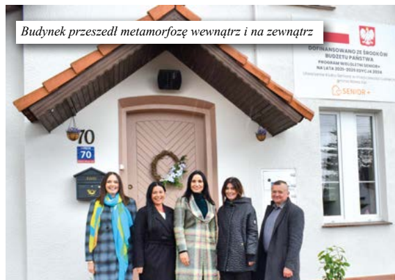
Budynek przeszedł metamorfozę wewnątrz i na zewnątrz